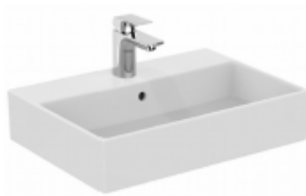
Wahlweise Waschtisch Badezimmer Strada 60x42cm