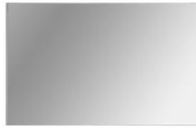
Spiegel Gäste WC Rechteckspiegel 60 x 40cm