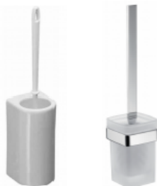
Bürstengarnitur - wahlweise in Keramik oder Glas