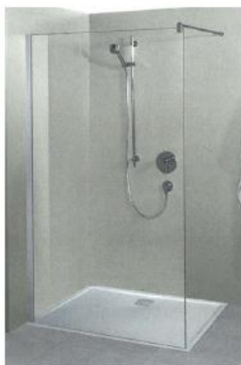
Dusche mit Duschtasse, Mineralguss 120x90cm Glas-Seitenwand freistehend Höhe 200cm