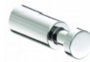
Handtuchhaken Gäste WC