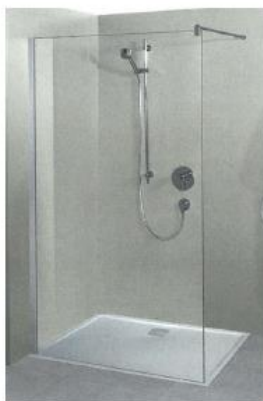
Dusche mit Duschwanne, Mineralguss 120x90cm Glas-Seitenwand freistehend Höhe 200cm