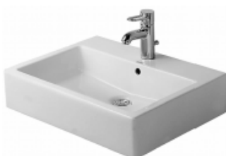
Waschtisch Badezimmer Vero 60x47cm