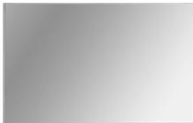
Spiegel Badezimmer Rechteckspiegel 80 x 60cm