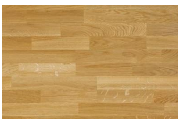
Parkett Eiche matt versiegelt inkl Sockelleiste aufgesetzt auf Trockenbau