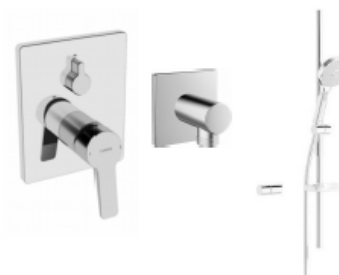
UP-Mischbatterie Brausestange 100cm Handbrause 3jet verchromt