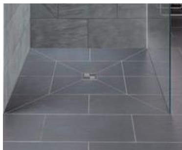
Dusche wahlweise auch verflies möglich (Farbkonzept offen)