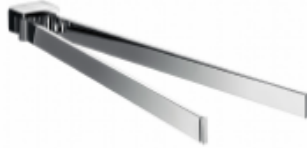
Handtuchhalter 2-tlg., verchromt