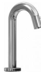
Armatur Handwaschbecken Kaltwasser