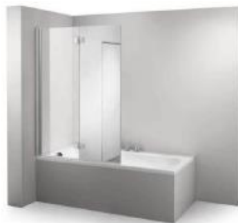
Badewannen-Faltwand, 2-tlg., 110cm Echtglas-Rahmen Alu eloxiert